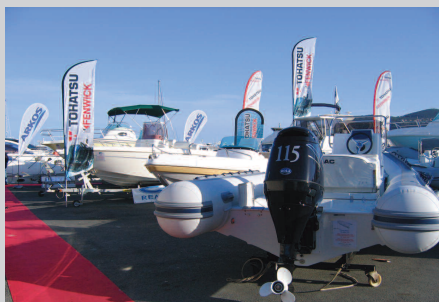
Salon de mandelieu sous le soleil d'Avril pour BOAT CENTER à Cannes.